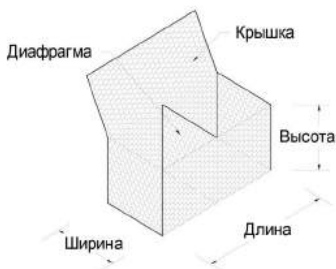
Таблица 1. Типовые размеры габрионных конструкций коробчатых