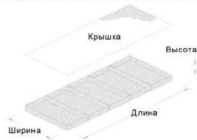
Таблица 3. Размеры габионных конструкций матрасного типа.